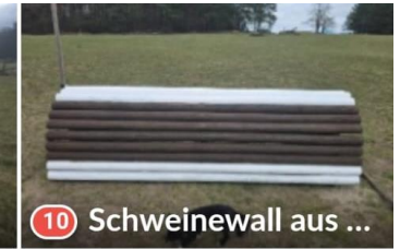
10 Schweinewall aus ...