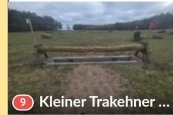
9 Kleiner Trakehner ...