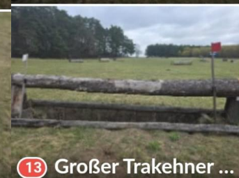
13 Großer Trakehner ...