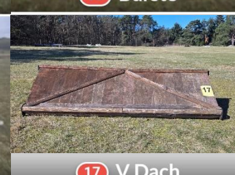
17 V Dach