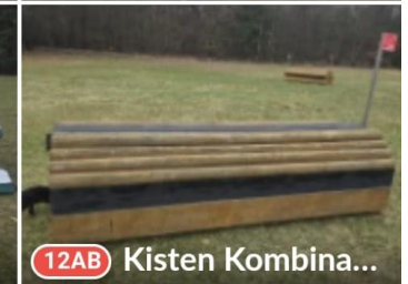
12AB Kisten Kombina...