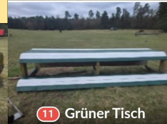
11 Grüner Tisch